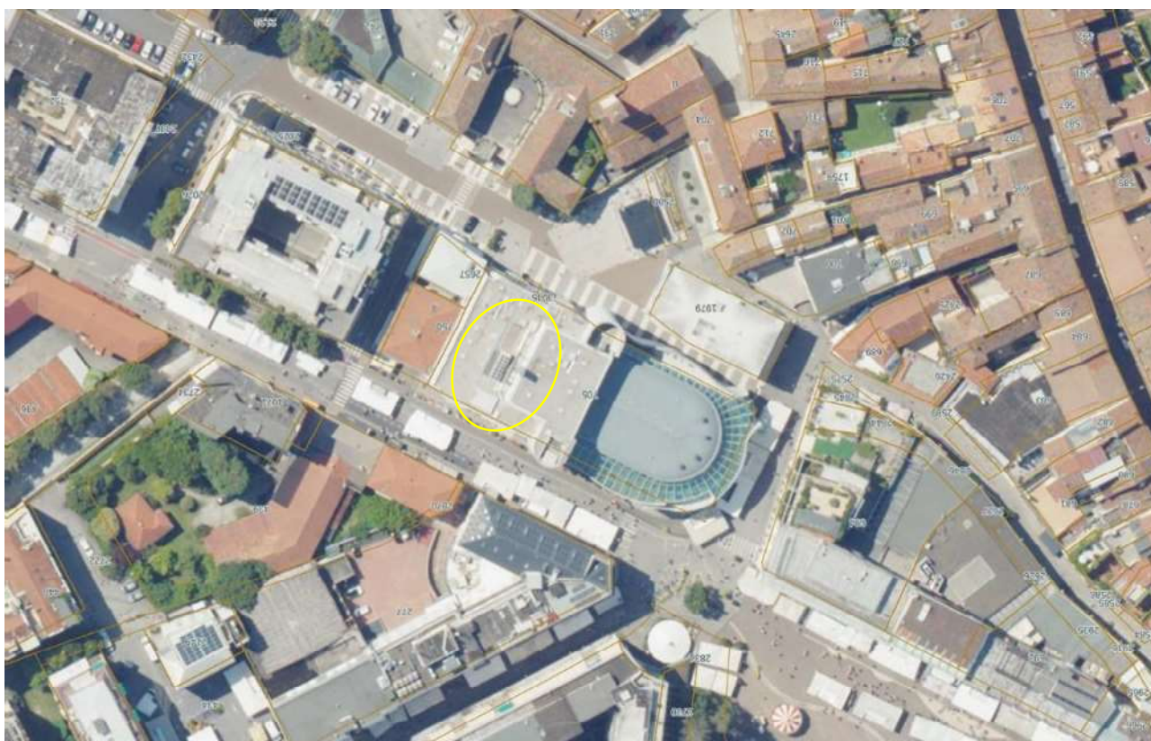
Fig. 3 – area oggetto di locazione antenna