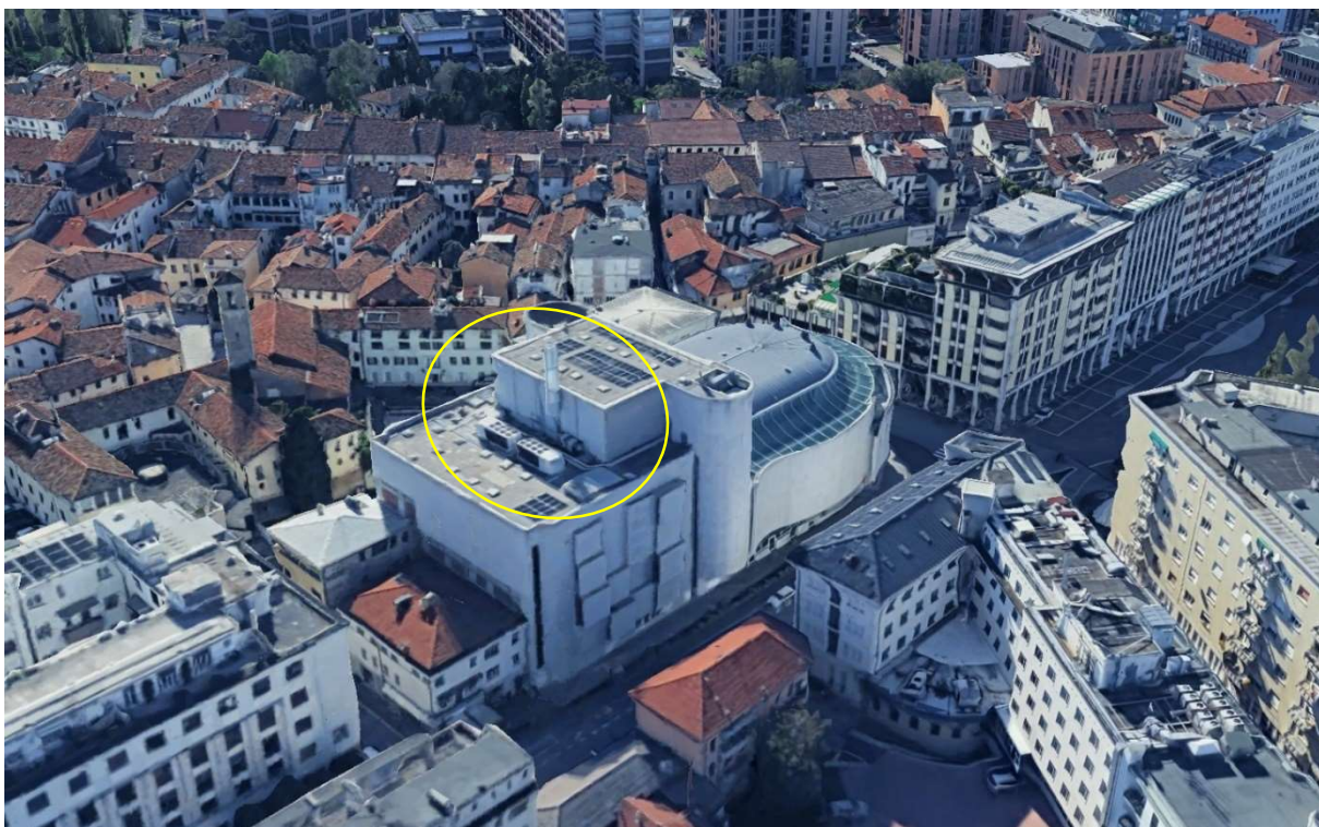
Fig. 2 – area oggetto di locazione antenna