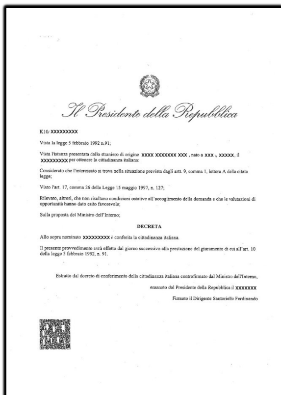
FAC SIMILE DECRETO DI CITTADINANZA