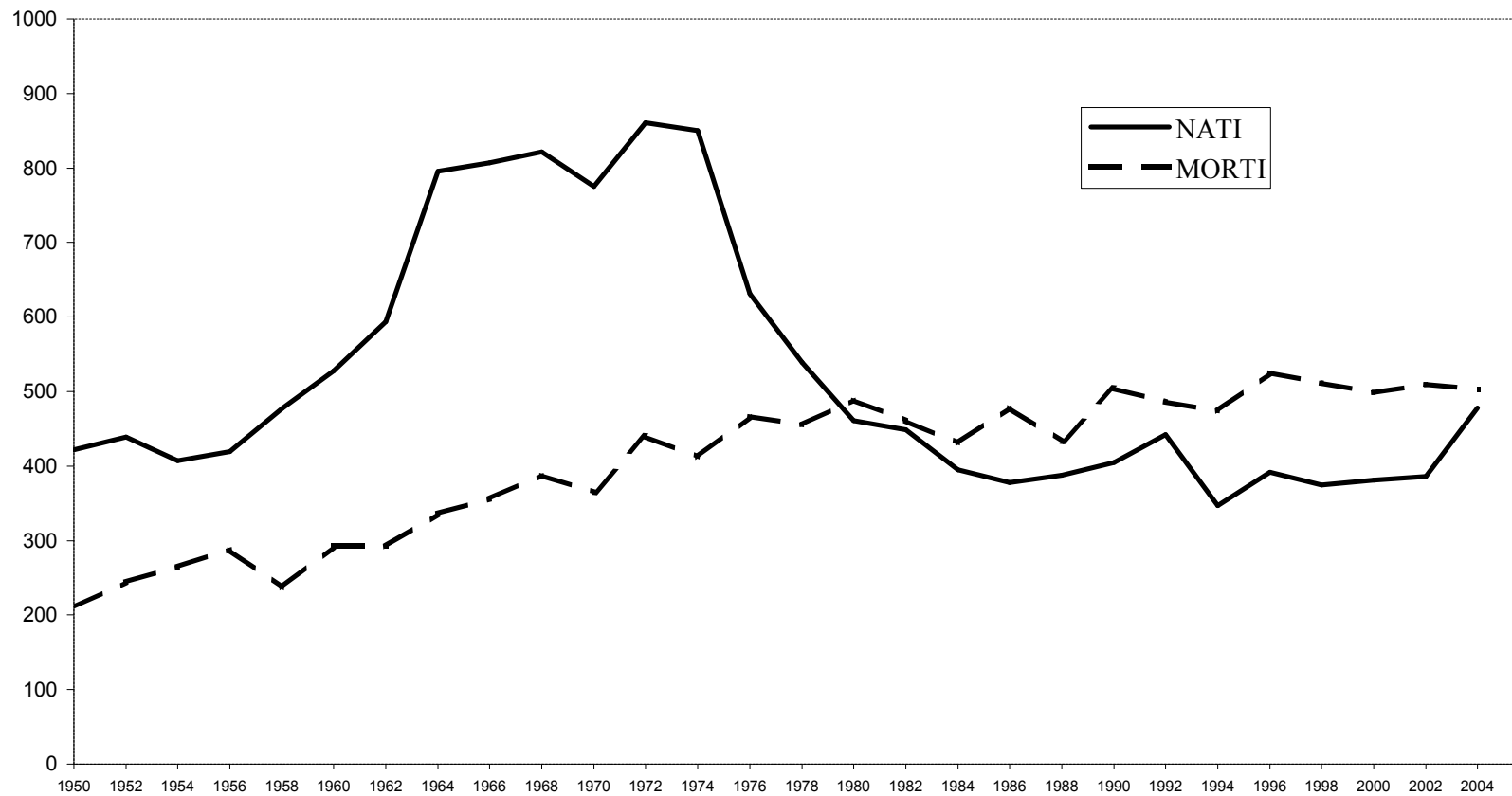
Movimento naturale popolazione residente dal 1950 al 2004