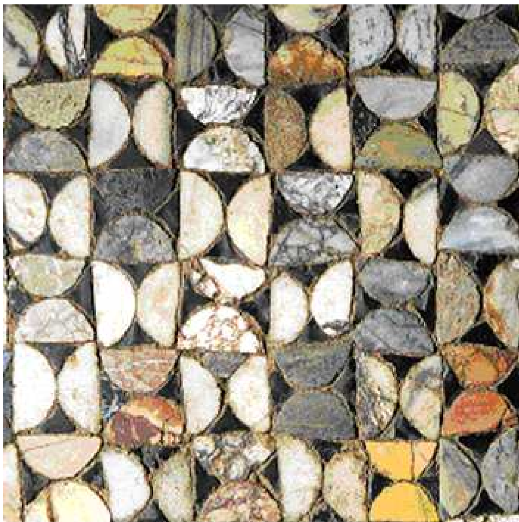
Bozzetto per esercitazioni del laboratorio di terrazzo