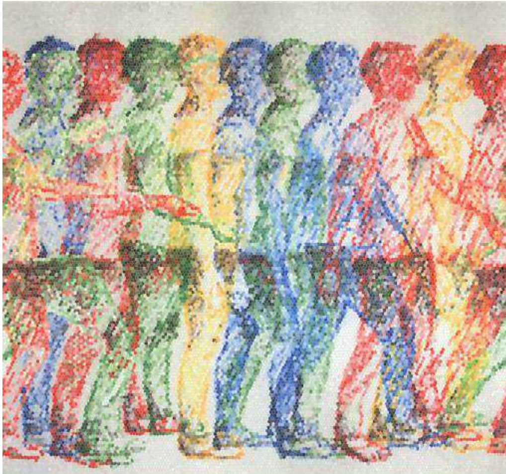
Bozzetto per mosaico – classe 3B