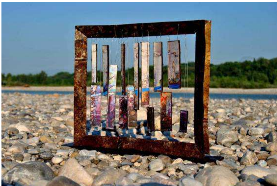
Struttura tridimensionale per traduzione musiva – realizzazione della M. Serena Leonarduzzi