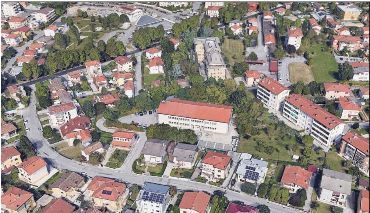
Google Earth vista 3d