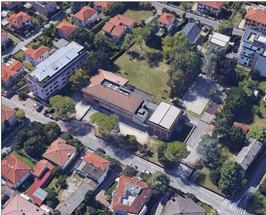
Google Earth vista 3d