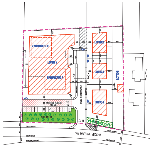
ZONIZZAZIONE - PLANIVOLUMETRICO SCALA 1:500