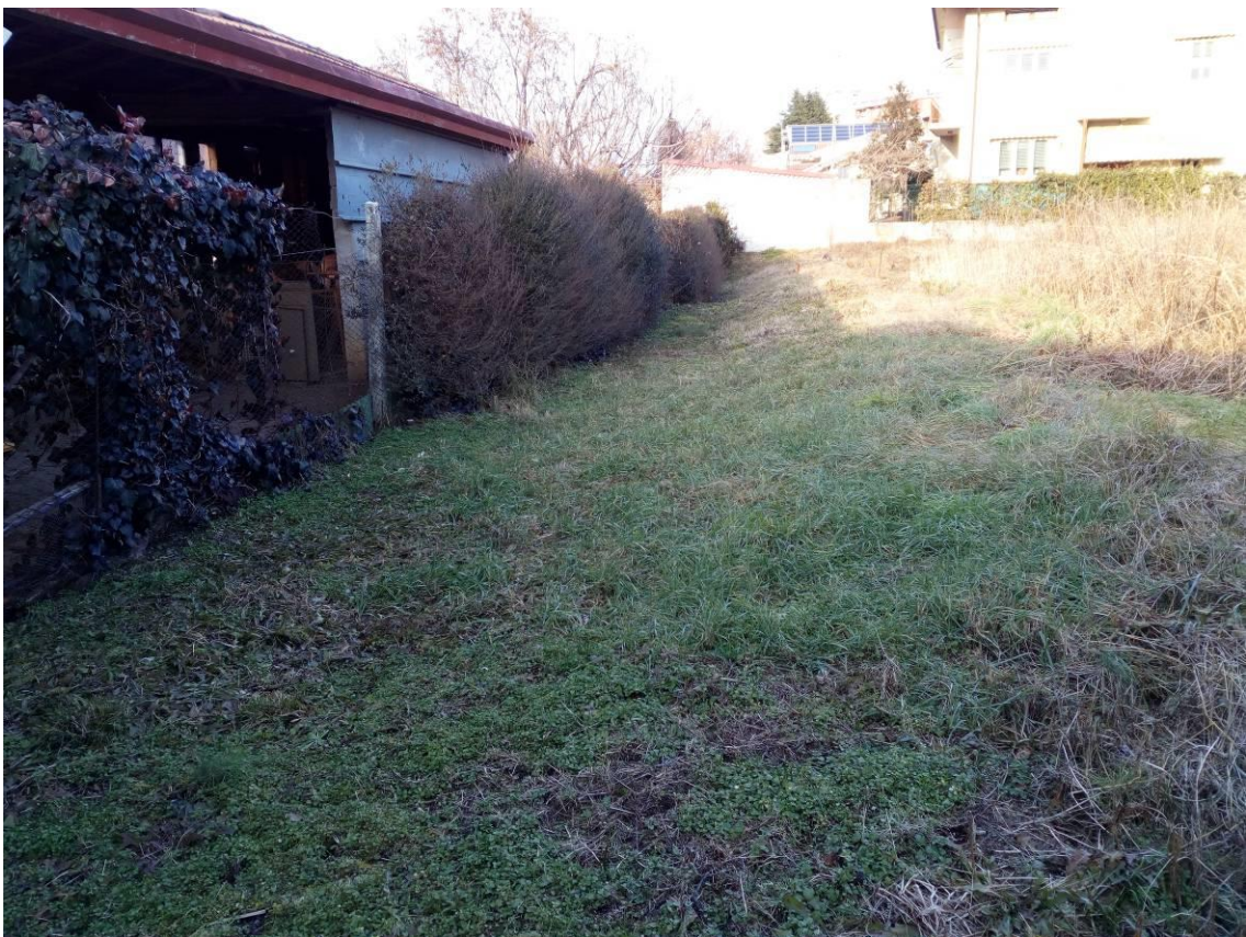
RIPRESA FOTOGRAFICA n.5