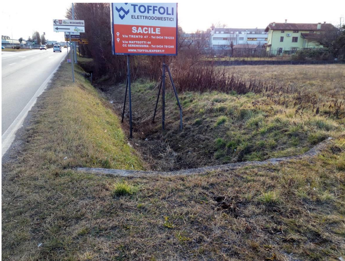
RIPRESA FOTOGRAFICA n.1