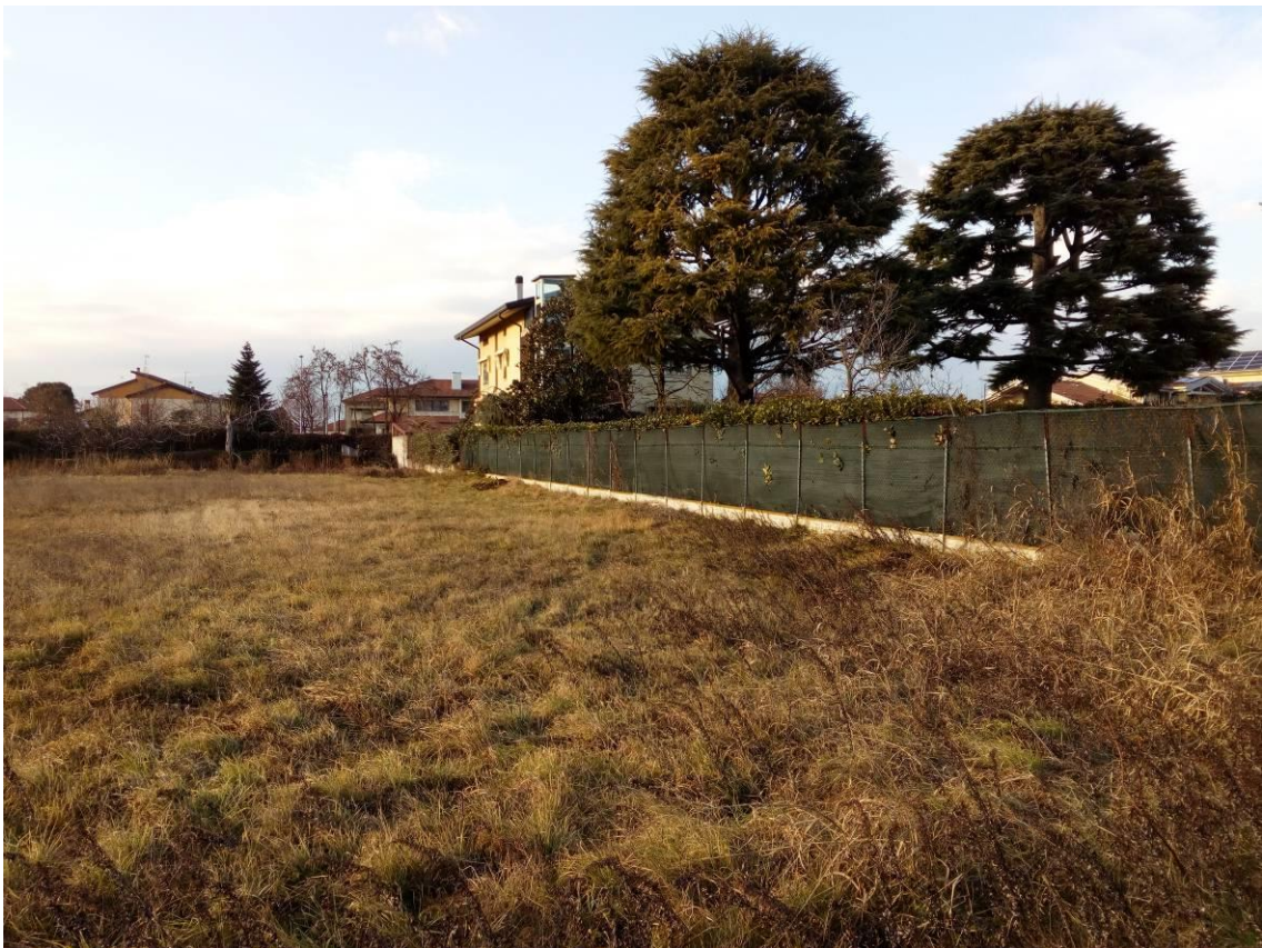
RIPRESA FOTOGRAFICA n.3