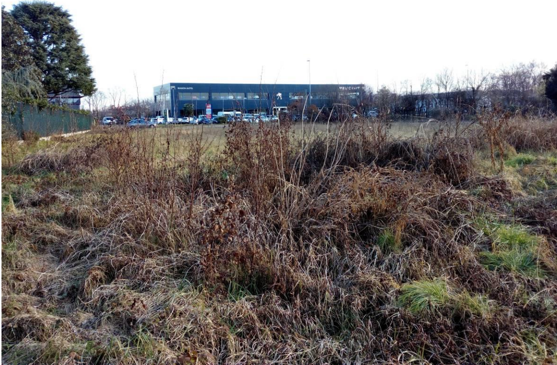
RIPRESA FOTOGRAFICA n.4