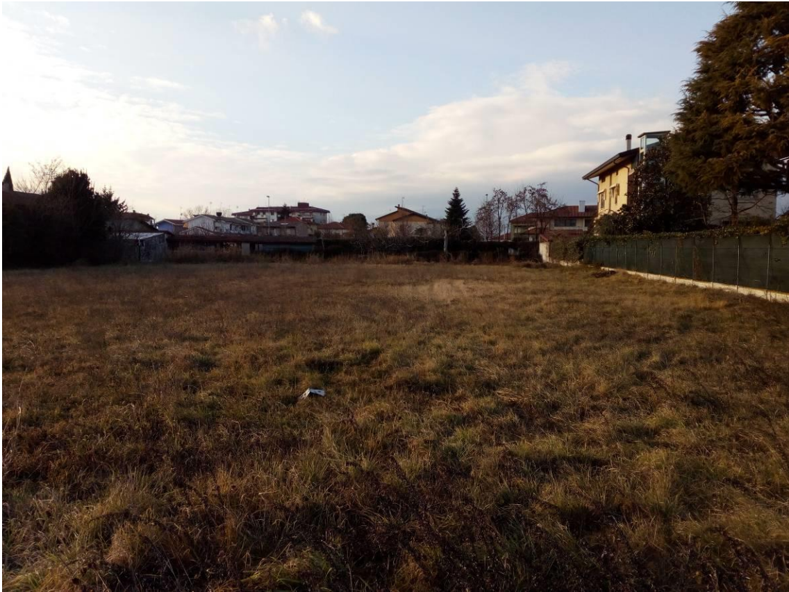
RIPRESA FOTOGRAFICA n.2