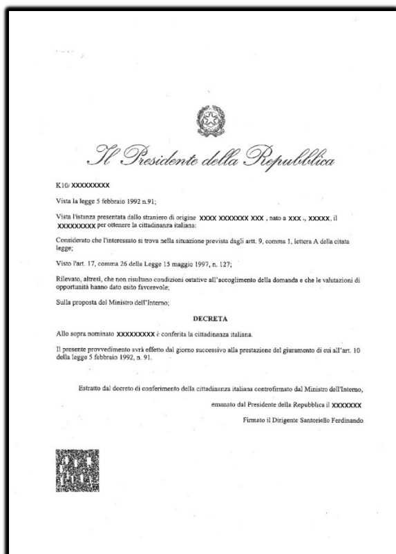
FAC SIMILE DECRETO DI CITTADINANZA

Nel testo della mail inserisci un numero di telefono .